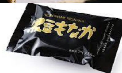
丹波篠山の黒豆使用 黒豆もなか 300円