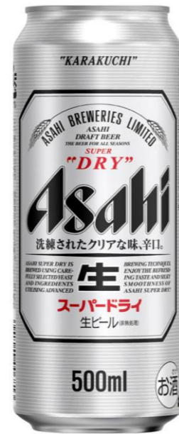
アサヒビール 500ml 500円