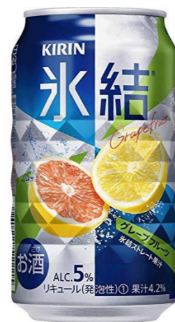
氷結(グレープフルーツ)350ml 300円