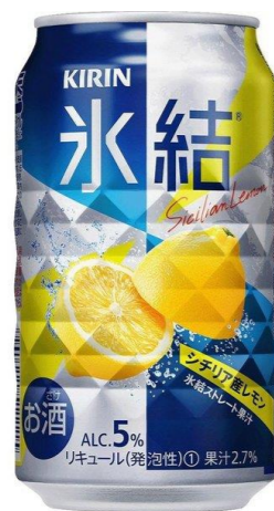
氷結 (レモン) 350ml 300円