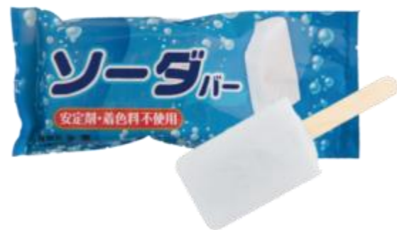
安定剤着色料不使用 ソーダバー 200円