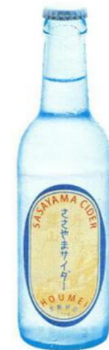
鳳鳴 ささやまサイダー330ml 300円