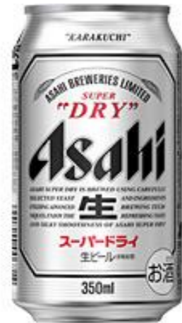
アサヒビール 350ml 350円