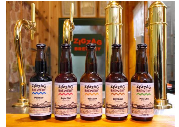
丹波篠山 ズグザグビール 800円