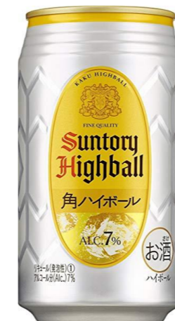
ハイボール 350ml 300円