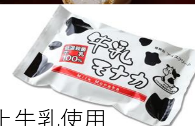
氷上牛乳使用 牛乳もなか 300円