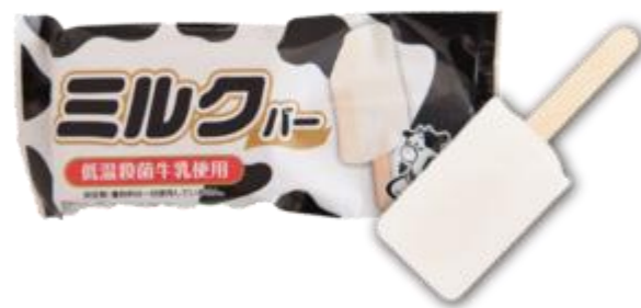
丹波氷上牛乳使用 ミルクバー 200円