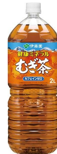
麦茶 2L 300円 イメージ

※その他、BBQ食材や、野菜、パンなどは、場内の湯あみ里山公園にて、販売しております。