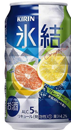
氷結(グレープフルーツ)350ml 300円