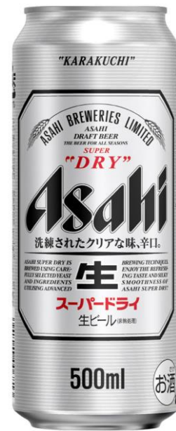
アサヒビール 500ml 500円