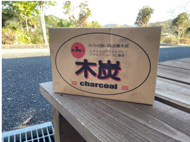
木炭 3.0kg 800円