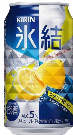
氷結 (レモン) 350ml 300円