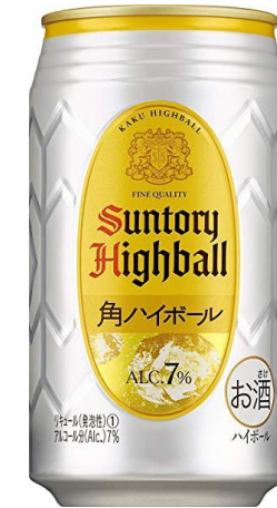
ハイボール 350ml 300円