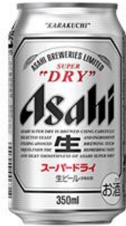
アサヒビール 350ml 350円