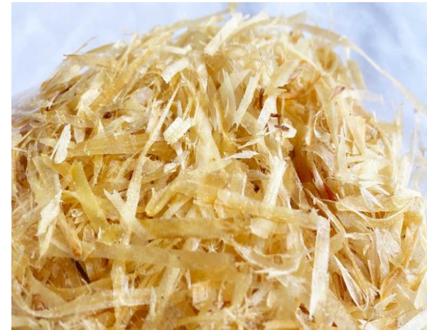
着火剤 シェービングウッドチップ 300円