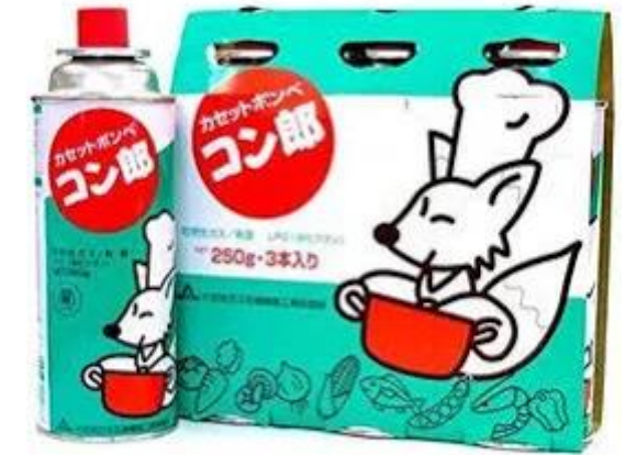
カセットボンベ 1本300円