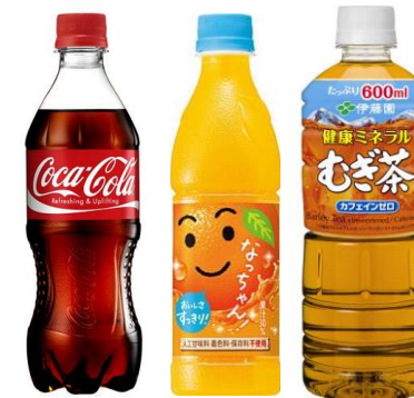
各種ソフトドリンク 150円 イメージ