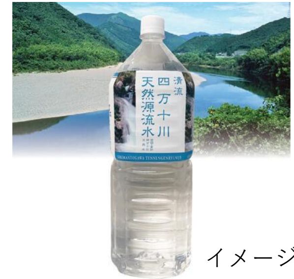
水 2L 300円 イメージ